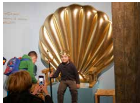
La stand photo de D'Eau Ré Mi, prenez la pose en sirène ou en triton !

Parce que la visite de nos expositions doit devenir une expérience sensible.