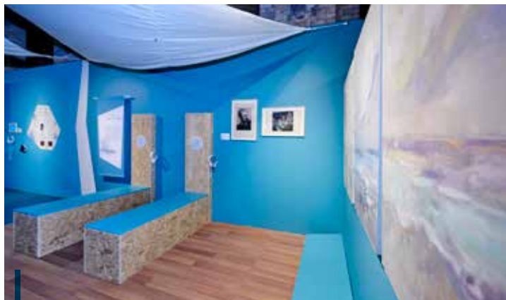
Cet espace scénographique allie l'écoute et la contemplation.