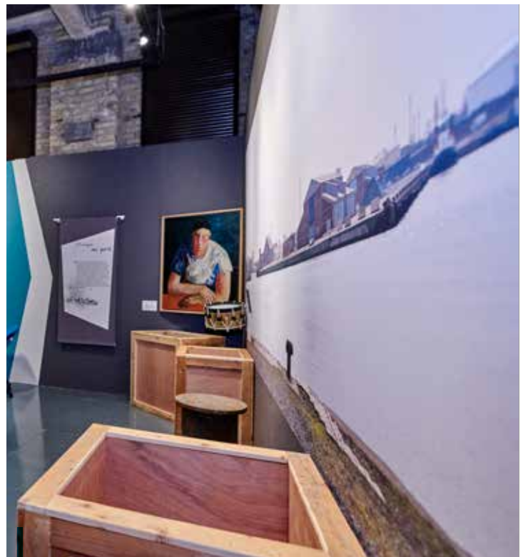
De Buenos Aires à Dunkerque, la musique prend ses quartiers au port.

lui, donne à Athènes l'image d'une ville rebelle célébrée par le rebetiko. Partout sur les quais, dans les cales des navires, les chants populaires ou de révolte accompagnent le travail de peine. L'importance de ces musiques décroît aujourd'hui pour laisser place à de nouvelles musiques urbaines nées de l'apport culturel de populations nouvellement exilées. Chaque port a des accents, une coloration sonore, une musicalité qui font son identité.