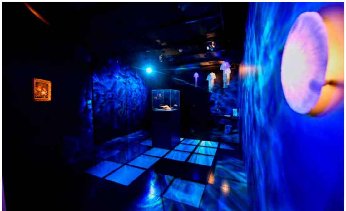
La première salle de l'exposition plonge le visiteur au cœur des fonds marins

cliquettent et les poissons chantent : certains ont un débit de mitraillette, d'autres roucoulent ou jacassent comme des oiseaux. Baleines et lamantins ont des chants modulés si proches de la voix humaine qu'ils sont probablement à l'origine du mythe de la sirène, au chant envoûtant, capable d'attirer le marin dans les flots.