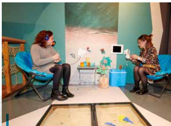
Quoi de mieux que la plage pour écouter les tubes de l'été ?