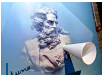
L'exposition présente différentes formes de modules d'écoute.

ont subsisté et se sont amalgamées aux nouvelles religions parmi les populations côtières. Aujourd'hui encore, de nombreuses communautés sollicitent la bienveillance et la générosité de la mer par des chants, des invocations et des offrandes adressés à une divinité, à un saint ou à un esprit protecteur, trait d'union entre les forces invisibles et les hommes.