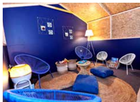
La cabane : un moment de détente en fin d'exposition

“PARCE QUE LA VISITE DE NOS EXPOSITIONS DOIT DEVENIR UNE EXPÉRIENCE SENSIBLE..”