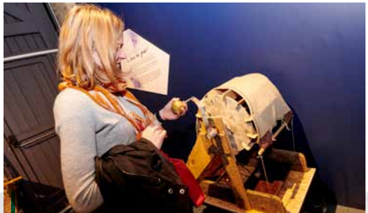
Ces machines ont été créées spécialement pour l'exposition