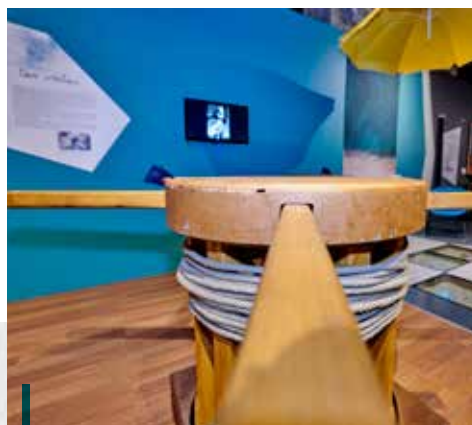
À bord, on chantait en travaillant.